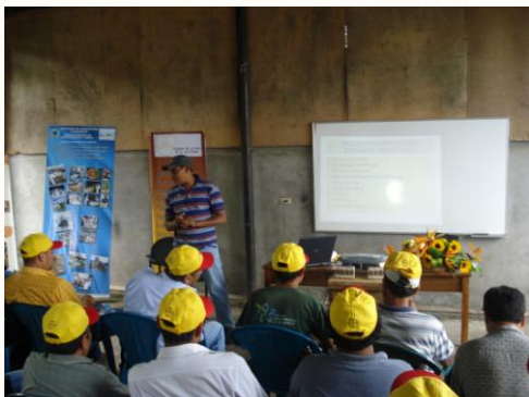
Rueda de Negocios Apícolas

Equipo apícola: velos, cepillos, espátulas